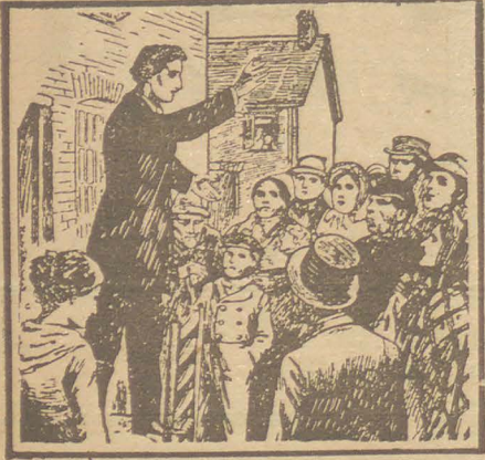
De Stichter als jongeling verkondigt de blijde Boodschap in de openlucht-samenkomst.

Afgunstig op Zijn populariteit onder het volk; onkundig, waar het Zijn Godheid betrof, vol haat tegen de reinheid van Zijn prediking, in opstand tegen het zelf-verloochenende karakter van Zijn handelingen en om vele andere redenen meer, besloten de Overpriesters, Ouderlingen en leden van den Hoogen Raad te Jeruzalem, om ten koste van alles Jezus' ondergang te bewerken. Daar zij echter de macht om te beslissen over leven en dood niet zelve bezaten, klaagden zij Hem aan voor Pilatus, den Romeinschen Landvoogd, als een godsdienstige bedrieger, een oproerling en een vijand van de Overheid, en eischten Zijn dood. Pilatus ontving den Heer, onderzocht de aanklachten, die tegen Hem ingevoerd waren, doch, daar hij geen schuld in Hem kon vinden, stelde Hij voor Hem vrij te laten. Tot zijn uiterste verbazing echter riep de schare als uit een mond: „Geef ons Barabbas!”