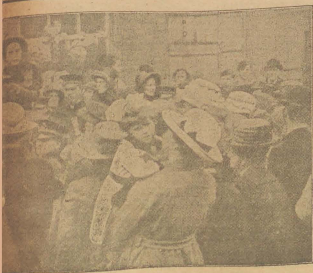
bedikt het evangelie op dezelfde plaats in grootvader, de Stichter, 78 jaar geleden de lossing verkondigde.

er van het Leger des Heils in Ned.-Indië.