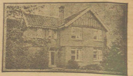
Het laatste „home" van den Stichter nabij Londen.