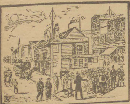
Evangelie-prediking door onzen Stichter in Whitechapel.

Ge moet iets met Hem doen; onzijdigheid is onmogelijk. In de gelegenheid te zijn, datgene te doen, wat recht is, legt reeds de verplichting op U, om het te doen. Daar is geen middenweg mogelijk in dit geval. Of gij zijt vóór Hem, of tégen Hem. Of gij laat Hem binnen in Uw hart, of gij verwerpt Hem tot Uw eigen ondergang. De wijze, waarop gij Jezus behandelt, zal bepalen, hoe de hemelsche Vader met U zal handelen. Wanneer gij een besluit neemt, hōe met Jezus te handelen, bedenk dan, wat het voor U beteekent. Bedenk, dat Jezus Christus de volle, vrije vergeving van iedere zonde voor ons gewrocht heeft bij den Vader, verzoening met Zichzelve tot stand bracht en reinheid, macht en vreugde in leven en sterven ons schonk. Van de wijze, waarop gij met Hem handelt, hangt Uw bestemming voor de eeuwigheid af: — hemel of hel.